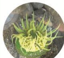
ミドリイソギンチャク